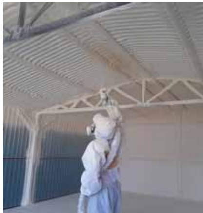
Zaizolování ocelové garáže proti kondenzaci