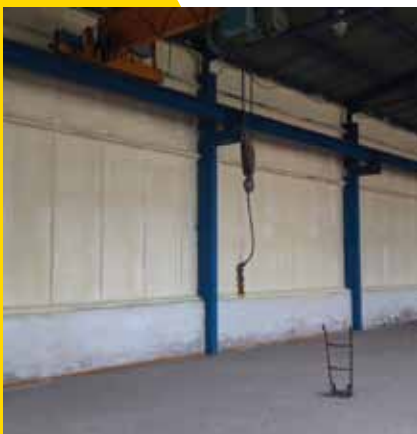
Zateplení stěny na průmyslovém objektu