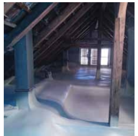
Zateplení podlahy půdního prostoru pochozí pěnou