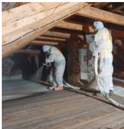
Zaizolování posledního stropu pochozí pěnou