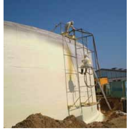
Tepečná izolace vnějšího pláště fermentoru