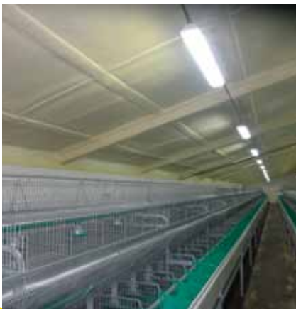
Izolace stropní konstrukce na odchovu králíků