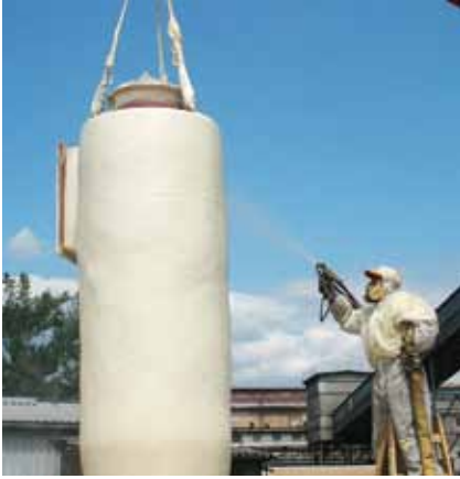
Bezspárá izolace na plášti ocelového nádrže