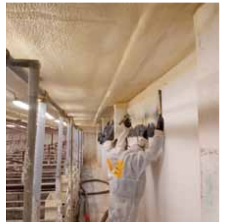
Zateplení stropu výkrmu prasat