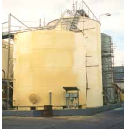
Izolace vnějšího opláštění nádrže „typ Vítkovice“