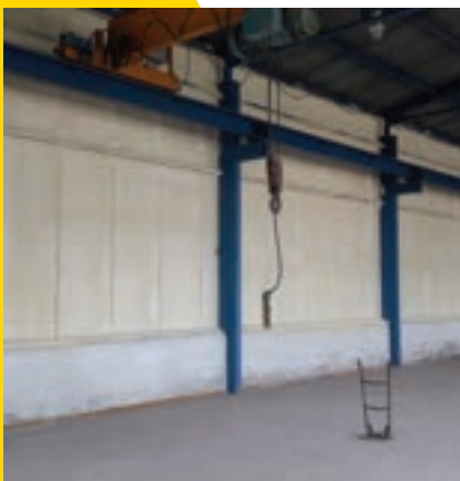
Zateplení stěny na průmyslovém objektu