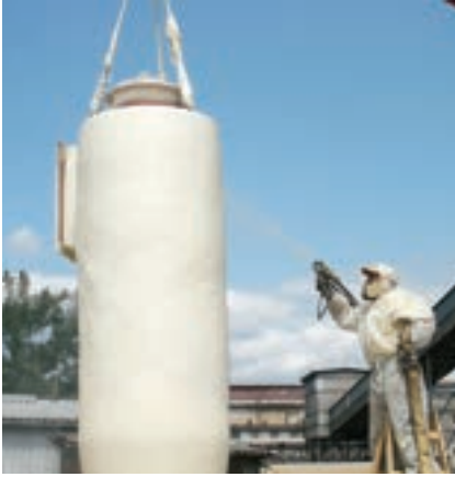
Bezspárá izolace na plášti ocelového nádrže