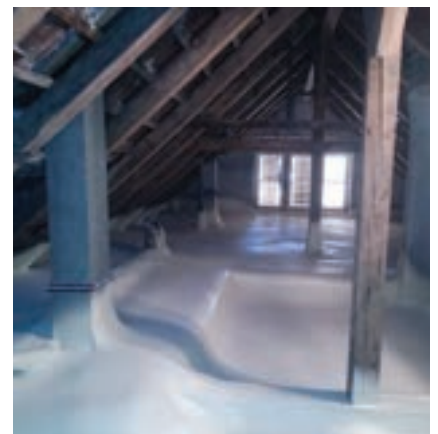
Zateplení podlahy půdního prostoru pochozí pěnou