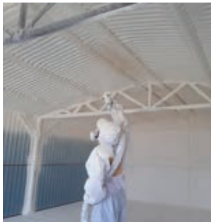
Zaizolování ocelové garáže proti kondenzaci