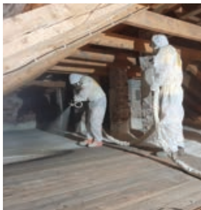
Zaizolování posledního stropu pochozí pěnou