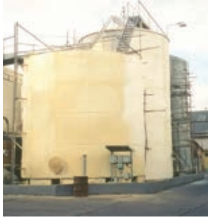
Izolace vnějšího opláštění nádrže „typ Vítkovice“