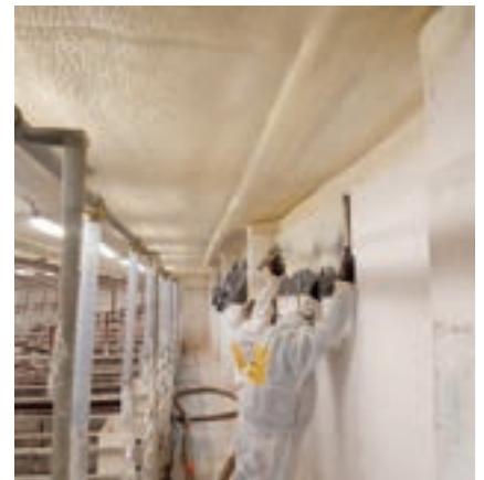
Zateplení stropu výkrmu prasat