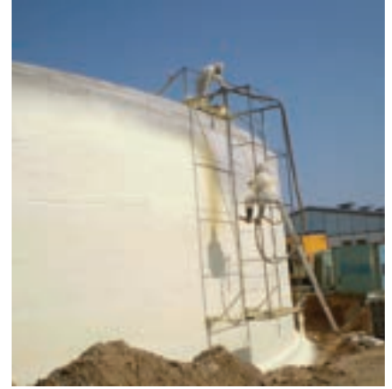
Tepečná izolace vnějšího pláště fermentoru